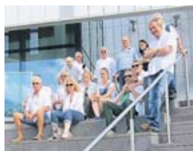
Das Humus-Ballett besteht bereits seit 35 Jahren.

KLEVE (RP) Die Männer des bekannten Klever Humus-Balletts, das inzwischen bereits sein 35 jähriges Bestehen feiern durfte, sind äußerst wandelbar, kreativ und lieben das Showbusiness – auch außerhalb des Karnevals. So ist die bunte Truppe auf diversen Veranstaltungen, Geburtstagen und Hochzeiten anzutreffen. Ob mit abwechslungsreicher Playbackshow oder dem jährlich einstudierten Wettbewerb – die bunte Klever Männertruppe ist ein Garant für gute Laune und ist sowohl abseits wie auf der Bühne immer für einen Scherz zu haben. Ausgiebige Lacher auf Seiten des Publikums sind bei ihren Auftritten garantiert.