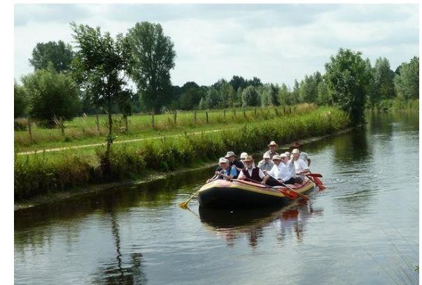
Farbfotos: private Aufnahmen von Pilgermärschen der vergangenen Jahre, hier mit dem Schlauchboot auf der Niers zwischen Schloss Wissen und „Jan an de Fähr“.