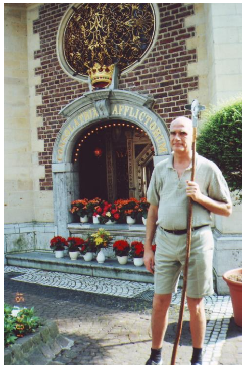
Foto: Vor der Gnadenkapelle in Kevelaer.