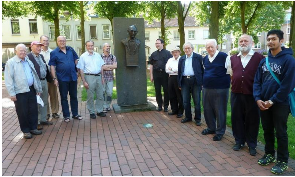
Foto: Am Karl-Leisner-Denkmal vor der Taufkirche in Rees.

Unter dem Leitwort „Hier bin ich – Missionar der Barmherzigkeit“ laden die schönstättischen Priestergemeinschaften von Montag, 8. bis Freitag, 12. August 2016 Priester, Priesteramtskandidaten und Diakone zum Karl-Leisner-Pilgermarsch nach Xanten ein.