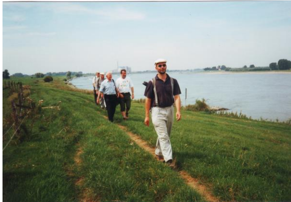
Foto: Zu Fuß durch die niederrheinische Landschaft.