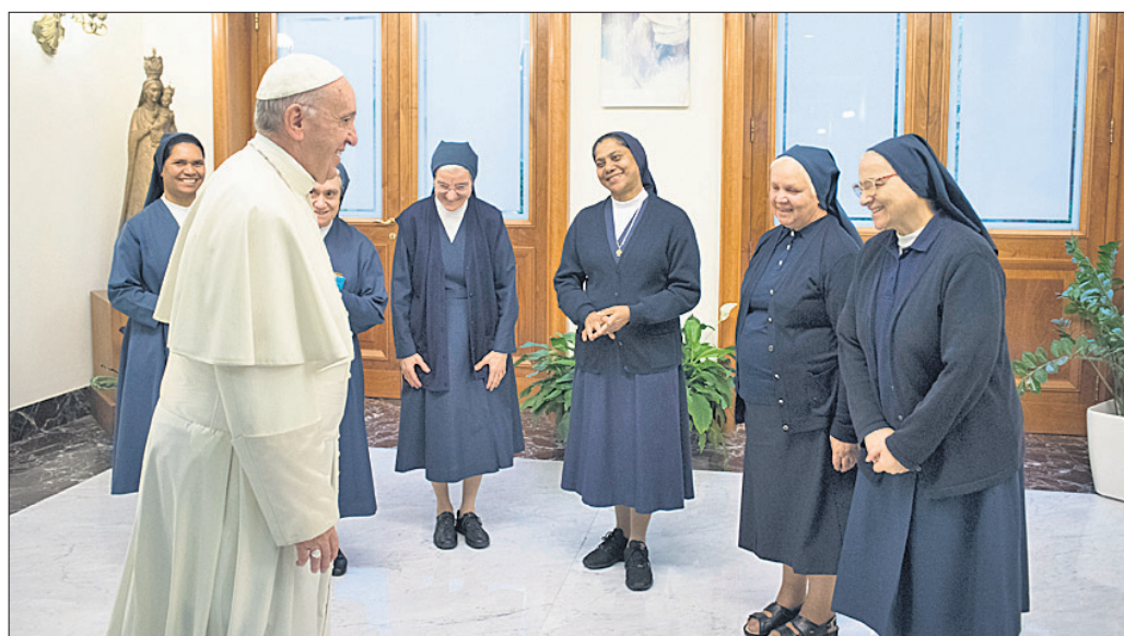
Am Gedenktag des heiligen Vinzenz von Paul, dem 27. September, feierte der Papst die heilige Messe in den Anliegen der Töchter der christlichen Liebe (Vinzentinerinnen), die das Gästehaus Santa Marta betreuen. Er dankte den Schwestern für ihren diskreten Dienst, den sie gleichsam wie »Schutzengel« leisteten. Bei den Fürbitten betete Franziskus insbesondere um Berufungen für die gesamte vinzentinische Familie.