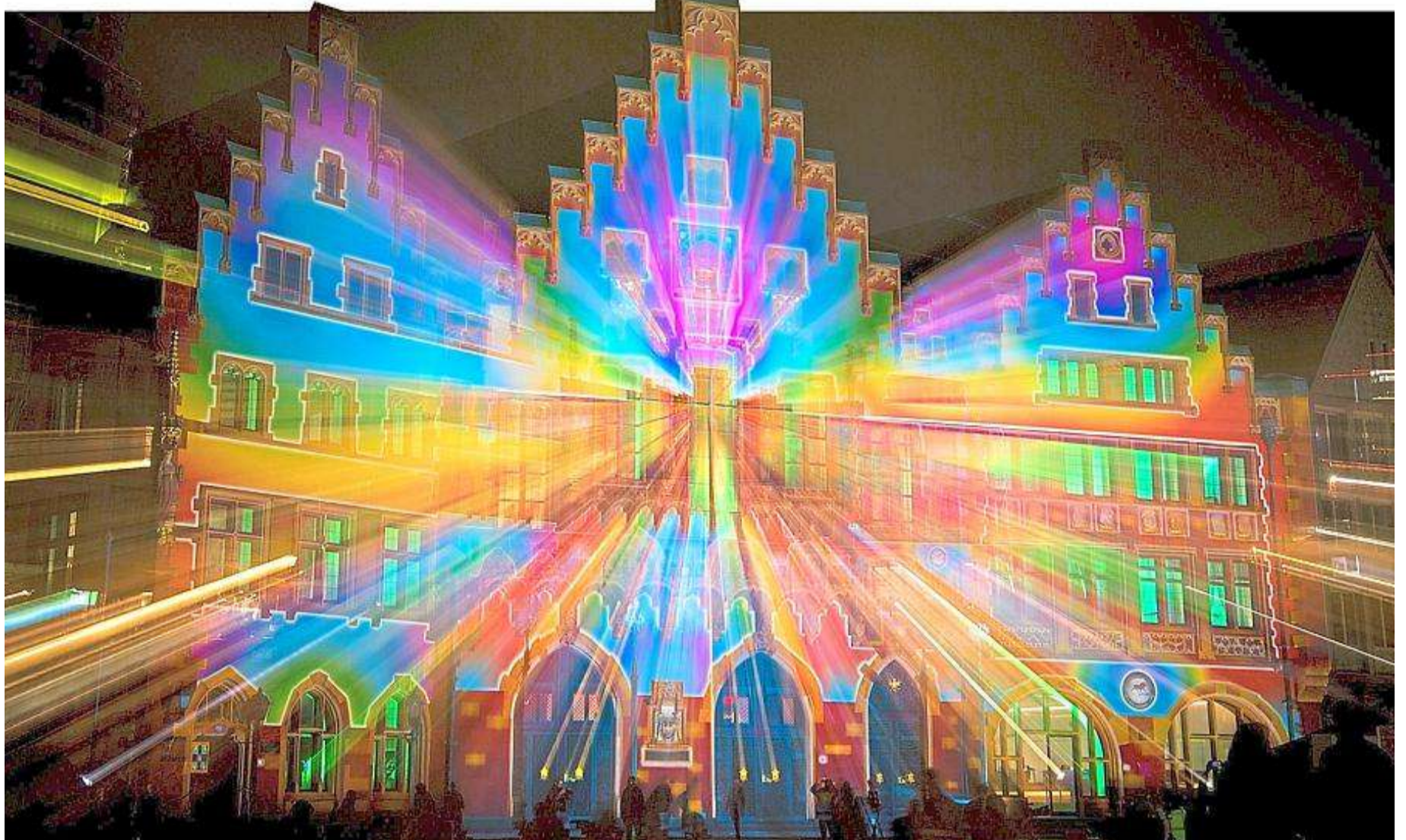
Bunt illuminiert ist der Römerberg in Frankfurt am Main. Der Lichtkünstler Patrice Warriner hat das Beleuchtungskonzept so zugeschnitten, dass die Betrachter die Quelle des Lichts möglichst nicht entdecken. Die Projektion ist ein Geschenk der französischen Partnerstadt Lyon an Frankfurt.

Frankreichs Pavillon braucht Asterix nicht / Prominente Autoren / 270 Millionen sprechen Französisch