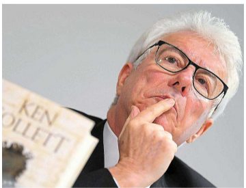
Ken Follett ist Gast auf der Buchmesse.

FRANKFURT (dpa). Bestsellerautor Ken Follett („Das Fundament der Ewigkeit“) plant bereits seinen nächsten Roman. Seit Weihnachten arbeite er an einer neuen Geschichte, sagte der 68-jährige Brite auf der Frankfurter Buchmesse. Details dazu verrät er nicht. „Ich bin noch nicht ganz zufrieden mit der Idee“, sagte er. „Und wenn ich merke, sie ist nicht gut genug, dann werfe ich sie wieder weg.“ Wie in seinen bisherigen Romanen recherchierte er die Hintergründe zu einer möglichen Geschichte selbst.