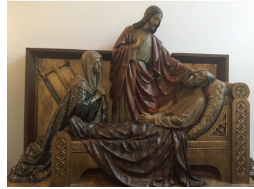
Foto: Het sterven van Jozef in nabijheid van Jezus en Maria. Zo werd Sint Jozef patroon van een zalige dood. Beeld in de Heilig Kruiskapel in Kevelaer.